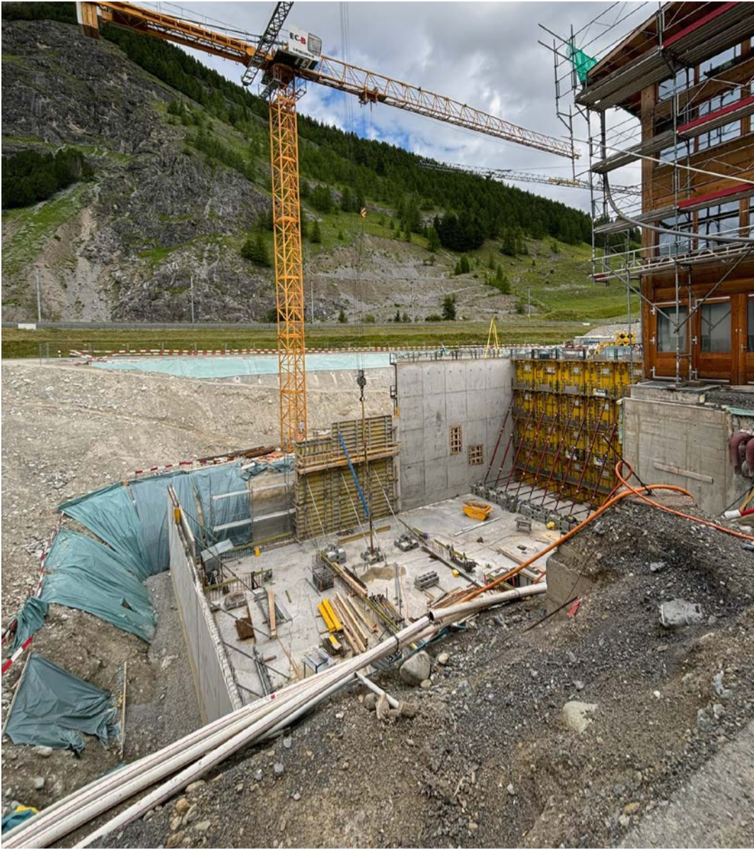
Ûn sguard illa fouruna, inua cha vain realiso il nou implant d'energia da la ditta Salzgeber S-chanf. Cò as vezza giò sün üna fopezza da var 12 meters.